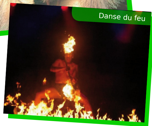
Danse du feu