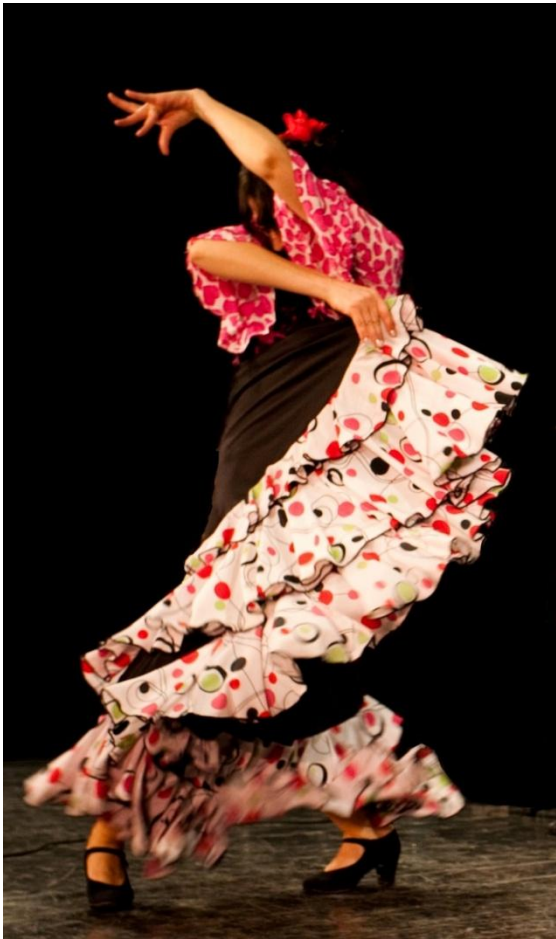
Danseuse de flamenco